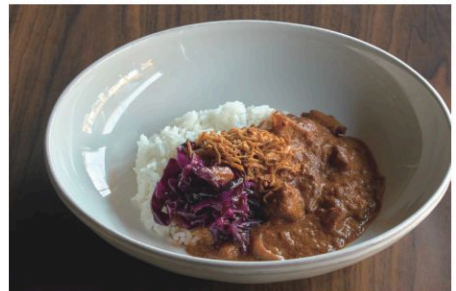
Spicy Pork Curry スパイスポークカレー