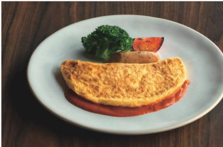
Italian Style Omelet With Tomato Sauce フリッタータ(イタリア風オムレット トマトソース)

Please select one from our four options. 4種類からおひとつお選びください。