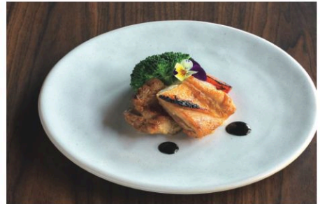
Grilled Chicken 石窯で焼いたグリルチキン