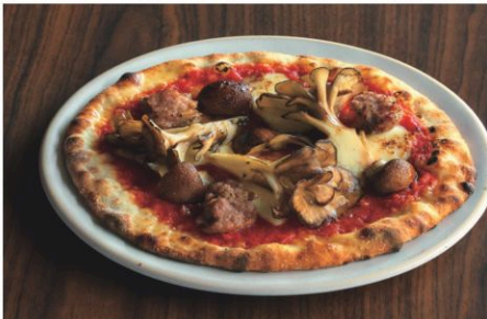
Pizza with Mushrooms and Salsiccia 2種のきのこサルシッチャのピッツア